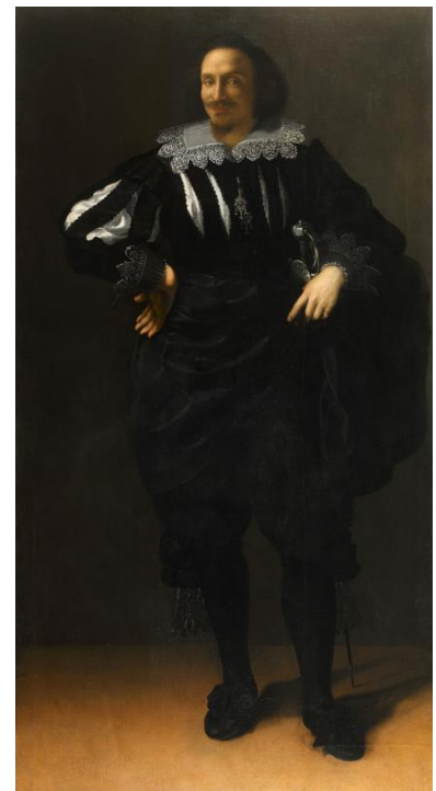
Portrait of a Man (Antoine de Ville) , Artemisia Gentileschi (1593-1654), 1630/5, oil on canvas, 204.5 x 109.2 cm, signed Robilant + Voena

2 The Close, Fore Street, Old Hatfield, Herts AL9 5AJ