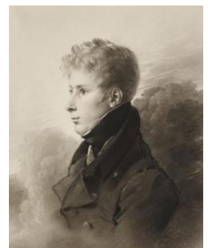
Portrait of Henry Beyle, called Stendhal (Grenoble 1783-Paris 1842), Pompeo Marchesi (1789-1858), 1814-1821, terracotta, 55 cm high with socle, Callisto Fine Art ; Inlaid marble table top , Jean Ménard (1552-1582), c.1565-68, cut marble with mother-of-pearl inlay, 94.5 x 77.6 x 4.5, Benappi Fine Art ; A Saracen's Head , white marble, probably Florence, circa 1500-1520, 47 x 33 cm, Gallery Desmet ; Portrait of Général Auguste Bertin de Veaux (1799-1879), aged eighteen years, Anne-Louis Girodet de Roussy-Trioson, called Girodet-Trioson (1767-1824), 1817, black and white chalk with stumping, 218 x 175 mm, Didier Aaron